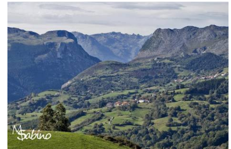
Valle de Karrantza.

Si quieres ampliar la información, escribe a esta dirección de e-mail: idoia@karrantza.org