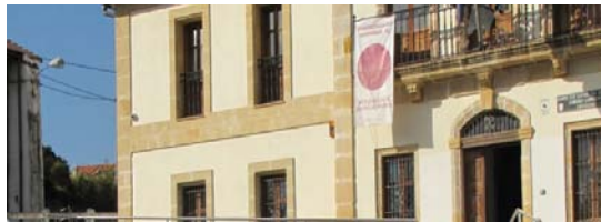
Punto lila en la balconada del Ayuntamiento de Barrika.