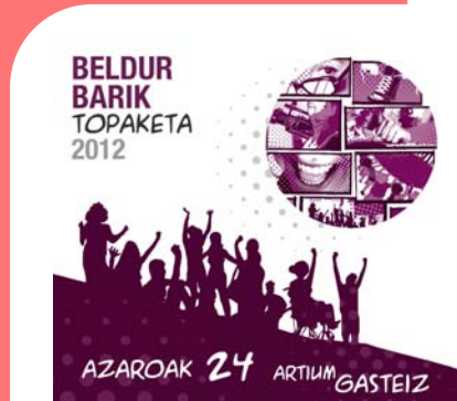
Programa Beldur Barik Topaketa 2012.

Web www.beldurbarik.org y perfiles de Facebook, Twitter y Tuenti.