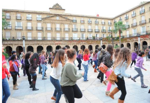
Flashmob en la Plaza Nueva de Bilbao.

El pasado sábado 10 de noviembre las tres capitales vascas acogieron una original iniciativa que, a través de la música, el baile y la participación, animó a la ciudadanía a mostrar su rechazo a la violencia sexista. Ese día tuvo lugar una flashmob en Bilbao, Donostia y Gasteiz para implicar a la sociedad más joven contra las agresiones y discriminaciones machistas y potenciar, a su vez, actitudes positivas de respeto, igualdad y libertad entre las chicas y chicos.