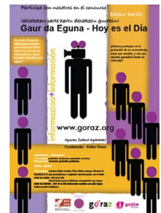
Cartel "Gaur da Eguna – Hoy es el Día".

Si quieres más información, escribe a la siguiente dirección de e-mail: udala@gordexola.net